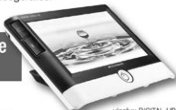
visolux DIGITAL HD Lesekomfort auf ganzer Linie